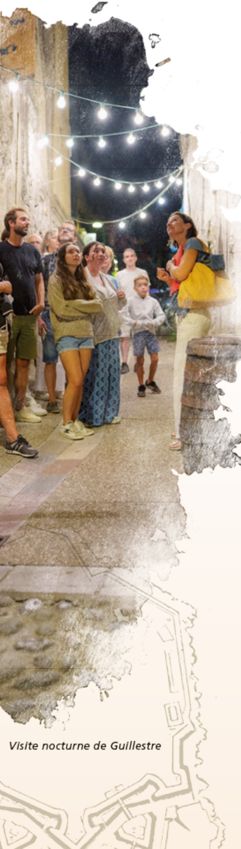
Visite nocturne de Guillestre

D'émotions intenses en sensations inédites, c'est l'occasion de te construire des souvenirs inoubliables et de t'offrir une parenthèse pour te reconnecter à l'essentiel.