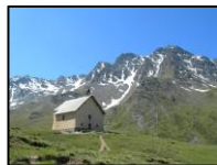
Chapelle de Clausis