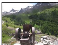
Mine de cuivre