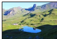
Refuge et lac de la Blanche

De la cabane de la Lavaite, en 15 minutes d'une balade familiale très facile, découvrez les vestiges de la mine de cuivre en parcourant le sentier d'interprétation libre et gratuit.